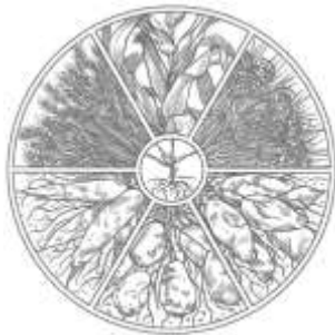
Figura 4.1. I tipi principali di sistemi radicali. Se centrali e se laterali (radici).