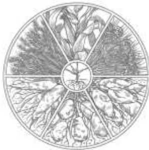
Figura 4.1. I sei piani del sistema radicale. Da: Zolle e radici (2015).