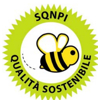
Figura 1: Logo del marchio Produzione Integrata previsto dal Sistema di Qualità Nazionale

SISTEMA DI QUALITÀ NAZIONALE PRODUZIONE INTEGRATA